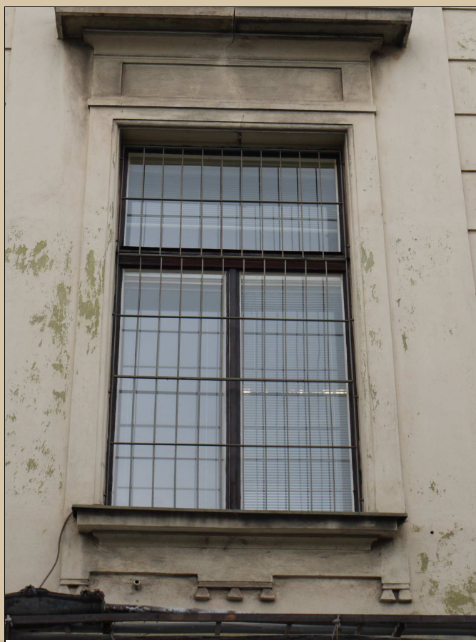
pohled na okenní mříž